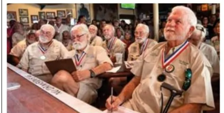
Juryn består av tidigare vinnare i Hemingway look-liketävlingen på Sloppy Joe's Bar i Key West, Florida.

"Jag har väldigt dålig koll på Taube, dock är äran att få ett pris i hans namn enorm då jag förstått att hans lyrik är en del av den svenska nationalskatten. Jag tackar och bockar och hoppas att min bästa lyrik ligger framför mig." (TT)