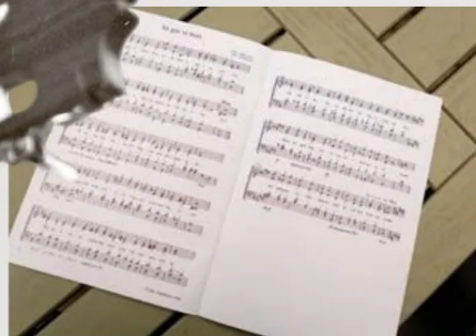
Handskrivna noter av O A.